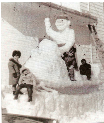
Joyeux Carnaval !

Pour toutes les parutions du Postillon de 2012, nous illustrons notre journal de photos ou d'images représentant l'histoire de Saint-Luc.